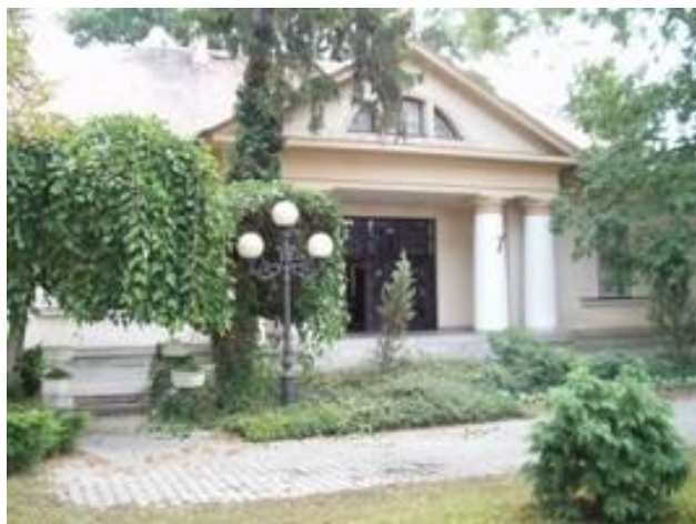
Budova primátorského úradu