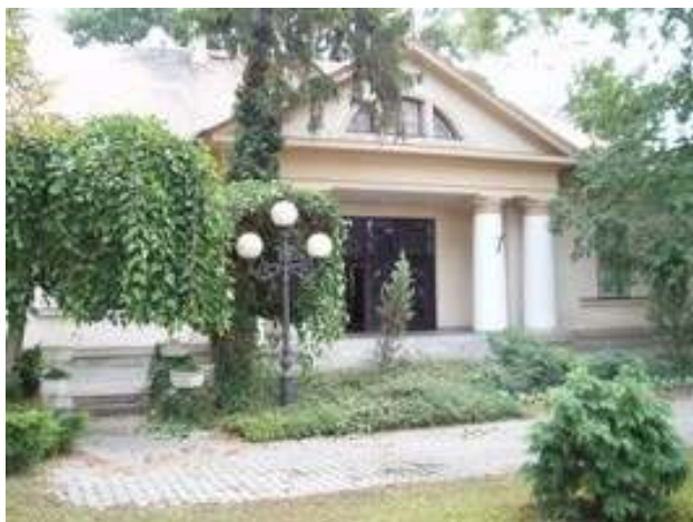
Budova primátorského úradu